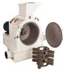
Hammermill Milling & Pulverizing