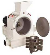
Hammermill Milling & Pulverizing